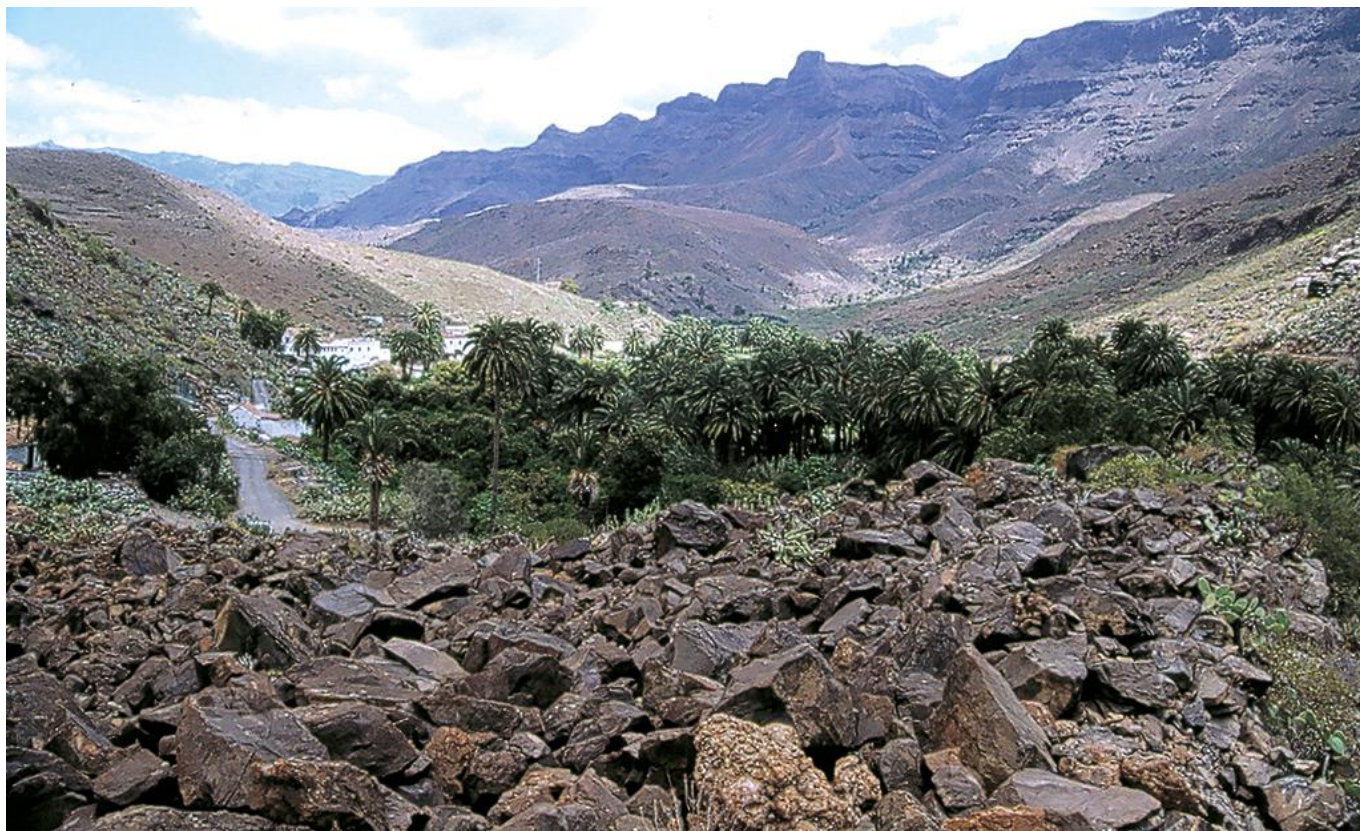
Necrópolis y palmeral