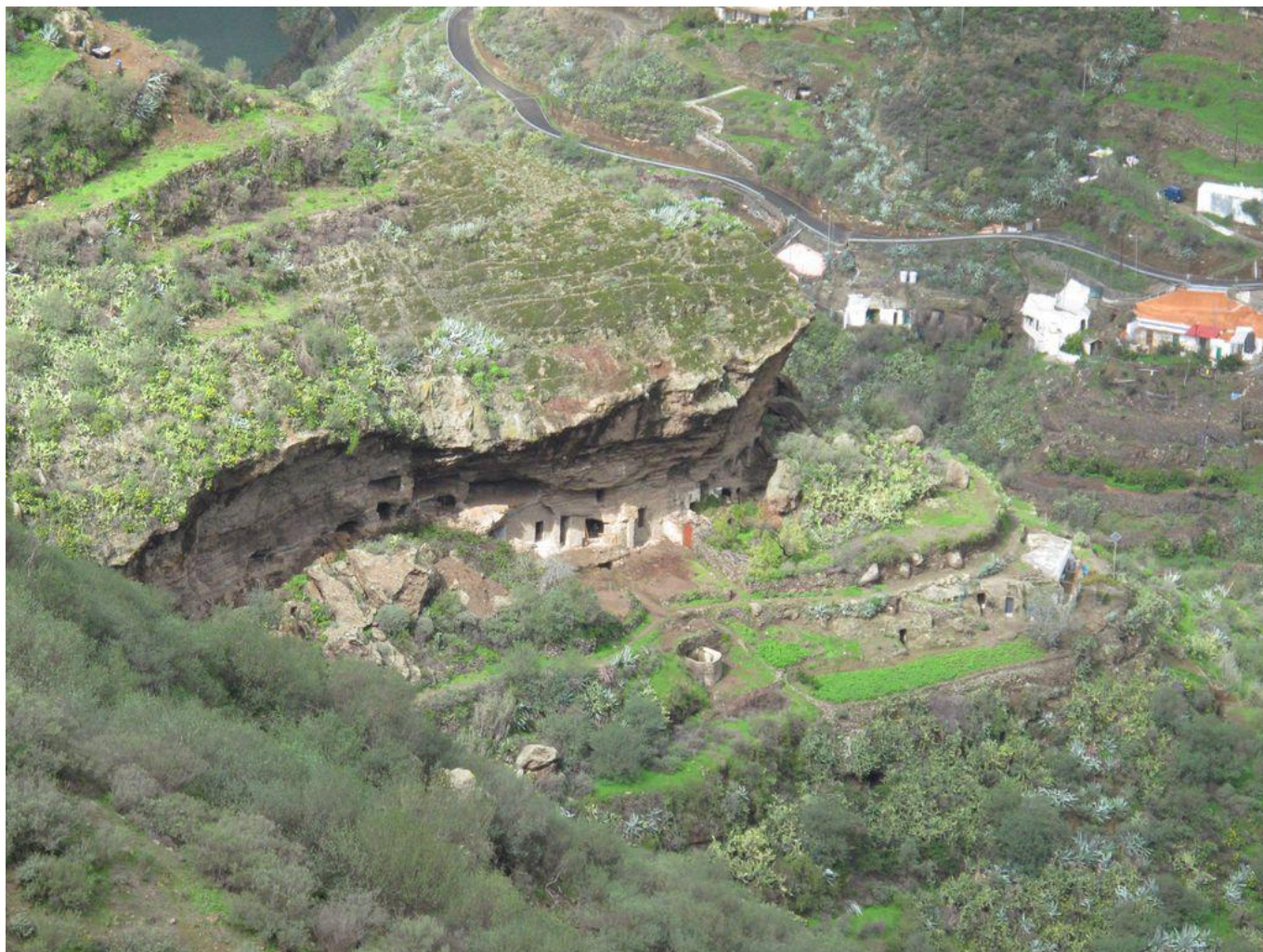
Vista general del conjunto