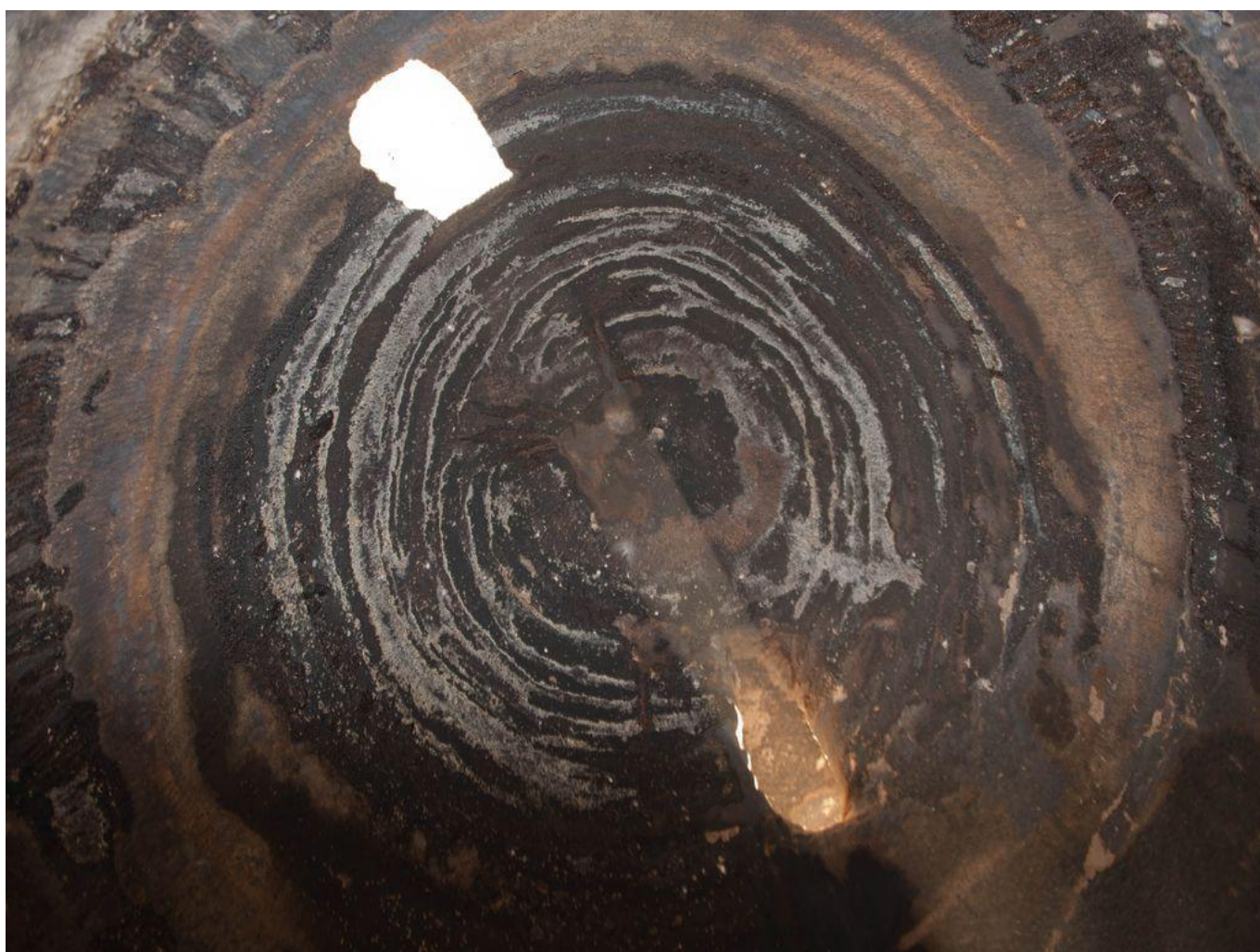
Detalle de la cúpula y efecto de luz en el interior de la Cueva nº 6

dataciones absolutas en contextos con manifestaciones rupestres. En este caso se ha datado, por un lado, un fragmento de madera integrado en la argamasa que sellaba una de las grietas de la espectacular cúpula de la cavidad (siglos XIII-XIV). La segunda, es una muestra de sedimento que contenía suficiente materia orgánica como para ser datado mediante C14 (siglo XV). Según describe el responsable de las intervenciones en este yacimiento, el citado sedimento se empleó para fijar una pequeña piedra que sirvió para formar la cazoleta en la que terminaba la representación del triángulo púbico de mayor tamaño de todo el panel, que ocupa, además, una posición central en la composición rupestre. Una datación que, en este caso, marca probablemente una reparación puntual del motivo grabado, cuya elaboración habría que remontar, por tanto, a fechas anteriores. La datación de la madera recuperada en la cúpula podría venir a reforzar esta propuesta.