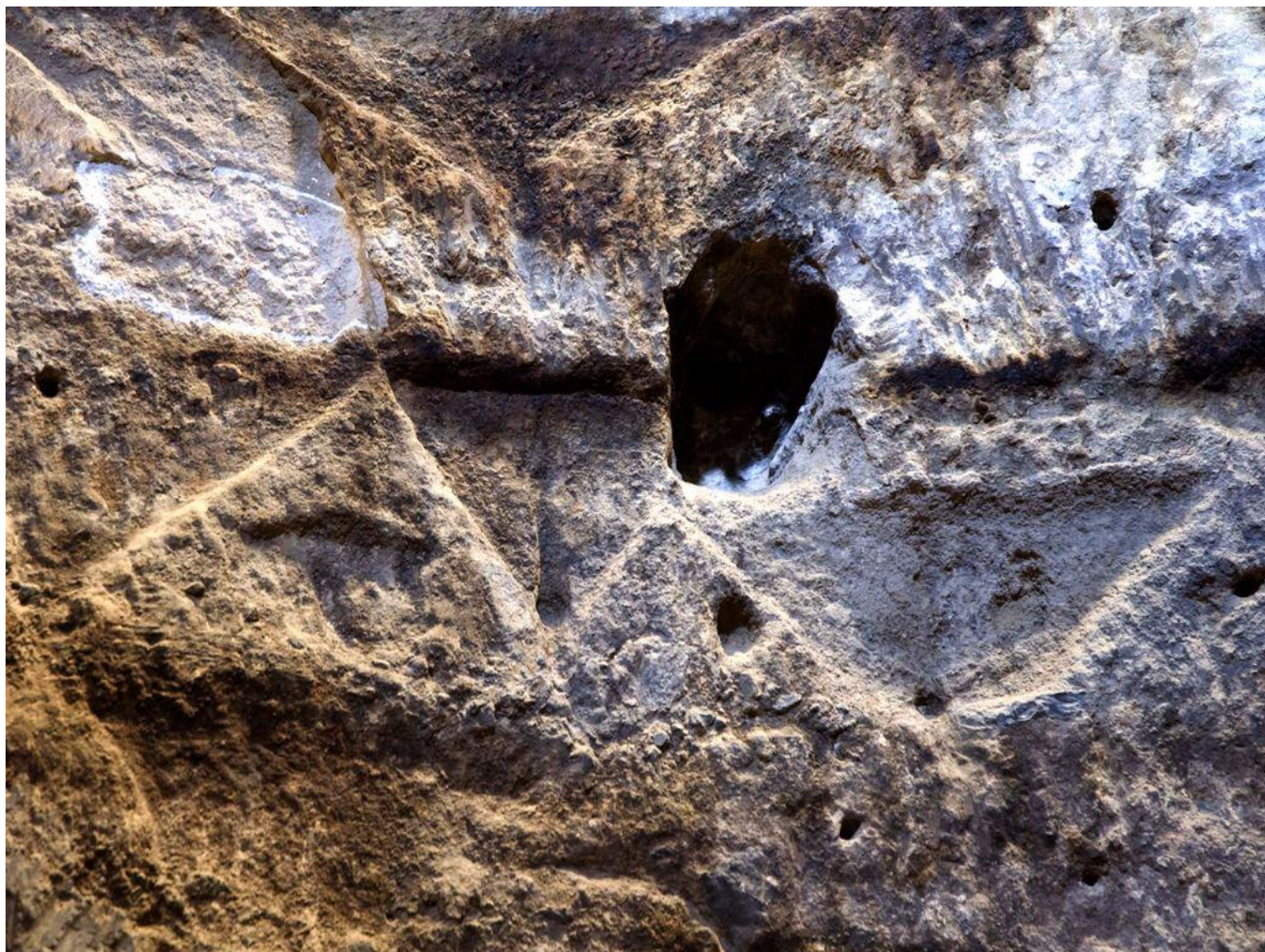
Detalle de grabados en el interior de la cueva 6